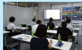
企業見学・職業体験