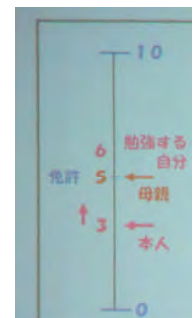
スケーリング技法

次に、「スケーリング技法」についてです。これは、今の状態を数値化して、その変化を客観的に知るという方法です。自分の気持ちを数値化し明確にすることで、本人の気持ちを親子が共に共有する手がかかりになると説明されました。