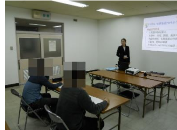
就職準備プログラム