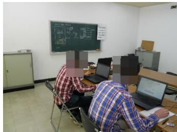
パソコン技能習得教室