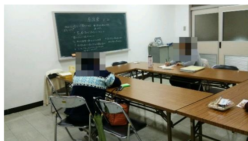
サポステ卒業生懇談会