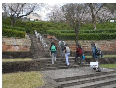
グループワーク (外出活動)