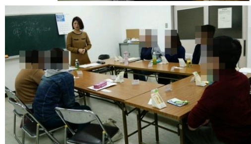
サポステ卒業生企業さんとの懇談会