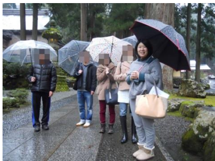
グループワーク (外出活動)