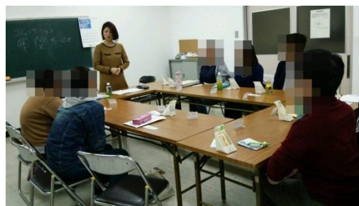
サポステ卒業企業さんとの懇談会