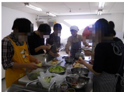
グループワーク (調理)