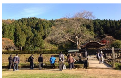
グループワーク【外出活動】 (朝倉氏遺跡へ見学)