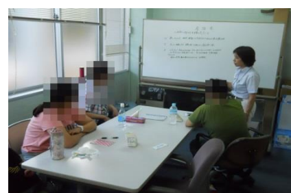
サポステ卒業者座談会