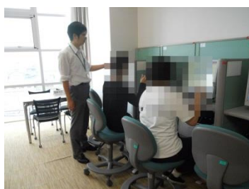
グループワーク【外出活動】 (ハローワークへ見学)