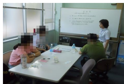
サポステ卒業者座談会