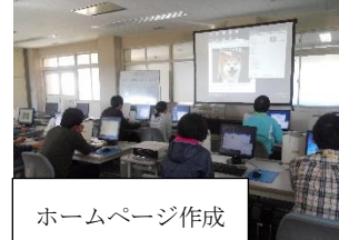
ホームページ作成

・ホームページを修正する仕事があることや、事務職の中で活用できることを学びました。