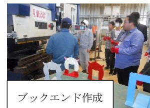
ブックエンド作成

各自好きなスプレー色で少しずつ色付けし、乾かしながら作業をすすめ、満足できる仕上がりとなりました。今回は一部分の体験となりましたが、製品の最初から完成までの作業工程を体験したいとの希望がたくさんありました。