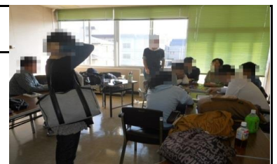
↑フリースペースの様子

多目的空間として、皆でゲームをしたり読書などで自分のペースで過ごしたり、面談前の心の整理や面談、各種プログラム、セミナー後の気づきやふり返しを行う場所として、また利用者同士の情報交換の場として、積極的にフリースペースを活用して前進しましょう。