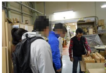
↑「(株)ヤマト工芸」工場内見学の様子

参加者からは、「仕事は楽しくないと続かないし、一生懸命やっていけば、いろいろと自分のやれることに気づくこと、人がどうするかでなくて、自分がどうするか等いろんな話が聞けてよかった。」「就職に向けて積極的な行動と持続が必要だと思った。」「今まで引っかかっていた仕事に対する疑問に、また新しい答え、価値観が出来た。いつか一端の社会人になれば、今日の御礼を伝えに行きたいです。」との感想がありました。